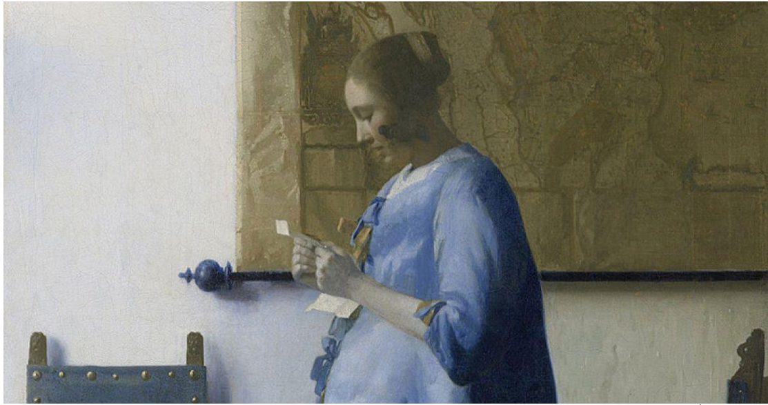
אשה בכחול קוראת מכתב, יאן ורמר

קריאת שירים וסיפורים בהם משולב תיאור של תמונה מזמנת לתלמיד מפגש ייחודי עם עולם מילולי וויזואלי. זהו מפגש בין צליל ומילה ובין צבע וצורה - דרכו נתן ללמוד על כוחה של המילה מול כוחה של התמונה - מתי תמונה אחת שווה אלף מילים ומתי אין למילים תחליף בתיאור רגש ומחשבה. במהלך הקורס יילמדו מושגי יסוד בתחום הייצוג המילולי של יצירות אמנות, האופנים השונים המשמשים לתיאור יצירות אמנות במילים, והפונקציות המגוונות שממלאת יצירת האמנות בסיפור ובשיר כמייצגות את החושים והמרחב. הקורס ילווה במצגות שיכילו את הציורים והסבר על התקופה והזרם האמנותי הנידון.